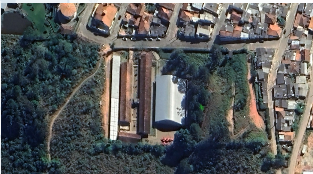
Foto 1:

Assim o presente estudo preliminar tem como propósito assegurar a viabilidade técnica da contratação de empresa de engenharia para execução dos serviços de Ampliação da Escola Municipal Padre Pivato.